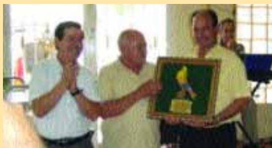
Entrega del cuadro