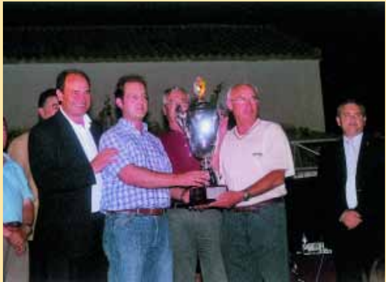
Segundo clasificado. T.F.

La última prueba fue bastante complicada de arbitrar. "Los palomos salían, no se fijaban con la paloma, habían muchas desconexiones, había mucha gente...", como explican los árbitros y hasta los últimos minutos no se decidió el ganador.