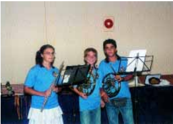
Los tres juveniles durante el pequeño concierto