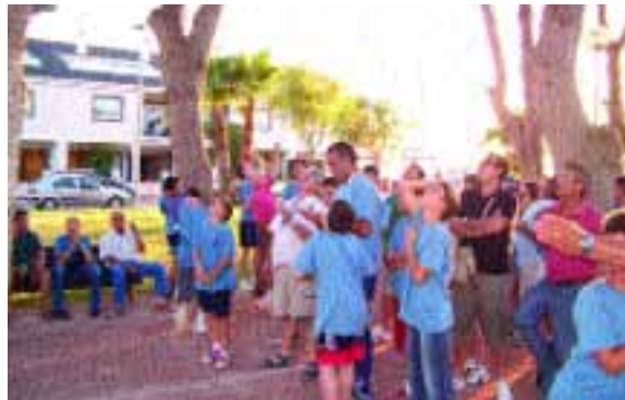
Juveniles de Murcia participantes en el campeonato