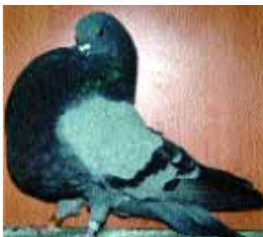
1.º COLILLANO ADULTO MACHO