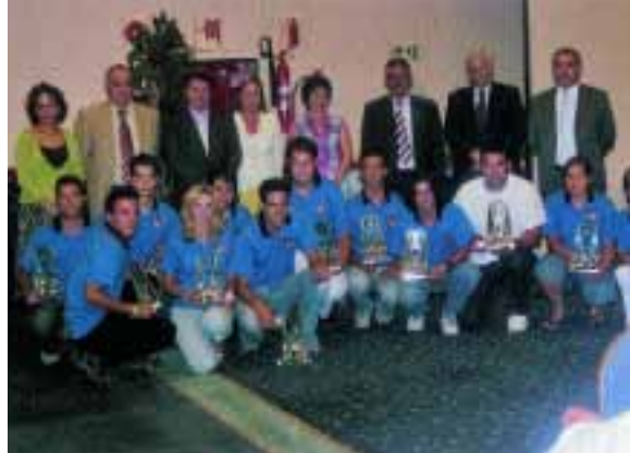
Equipo de monitores y autoridades