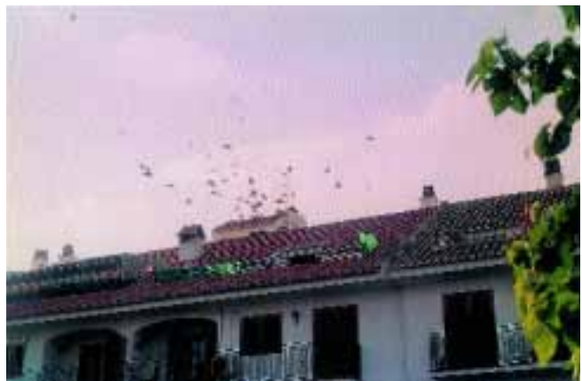
Detalle de la suelta final

INFORMACIÓN FACILITADA POR JOSE LUIS ROS