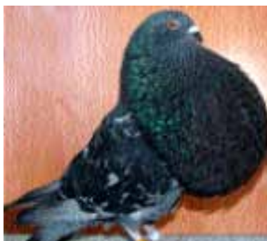
1.º GADITANO ADULTO MACHO