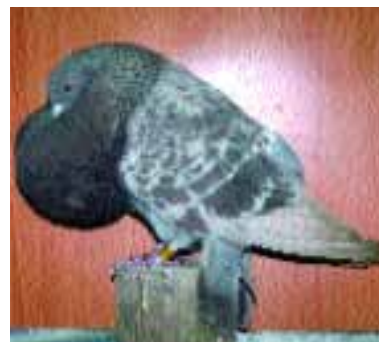
1.º MARCHENERO ADULTO MACHO