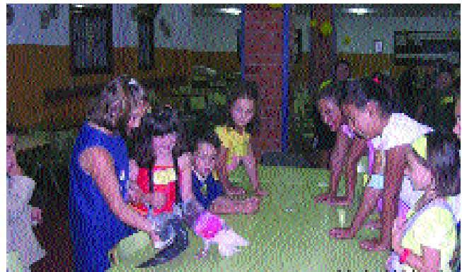
Diferentes instantáneas de los campamentos urbanos.

Nos quedamos muy contentos por cómo había resultado todo y la buena aceptación que recibieron los palomos, nosotros y la Colombicultura en general. Ahora sólo nos queda esperar su llamada impacientes para lograr que les guste de verdad y les interese tener