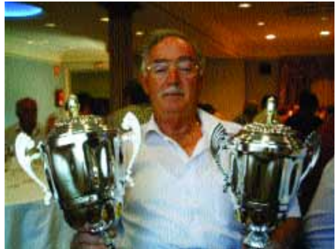
Ganador de la prueba

El domingo 29 de Mayo disfrutamos de una buena tarde, incluso ya algo calurosa, y celebramos la prueba espectáculo con lo