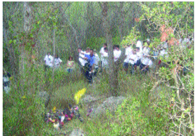
29 LOS JUVENILES ofrecieron un gran espectáculo en el campeonato de este año

3 REGULACIÓN SOBRE DESTEÑIDOS. La RFEC informa sobre el proceso de regularización.