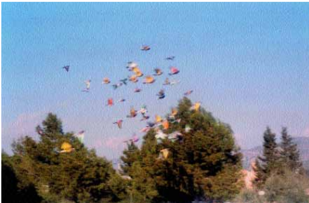
Suelta sobre palomares