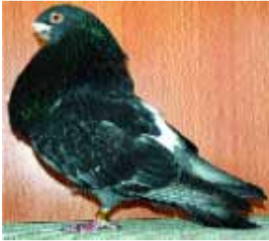
1.º RAFEÑO ADULTO