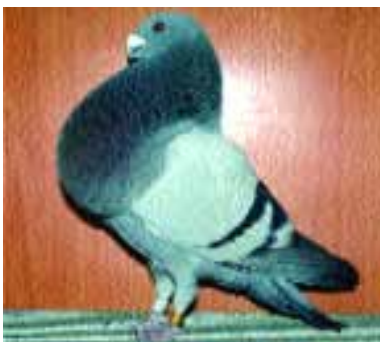
1.º JIENNENSE ADULTO