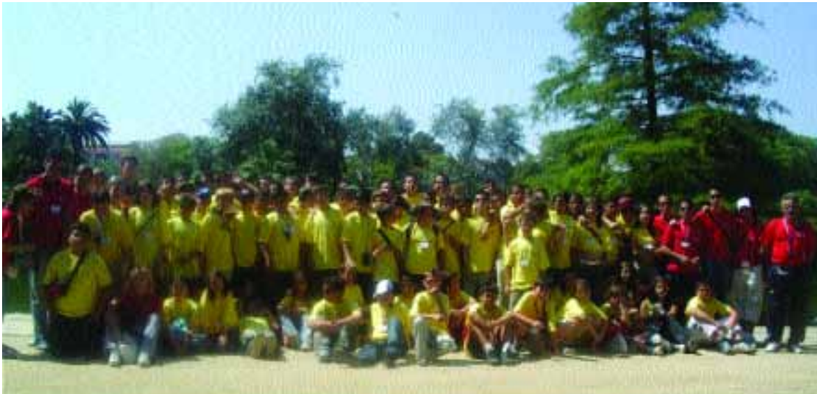
Juveniles, monitores y directivos participaron de todas las actividades celebradas