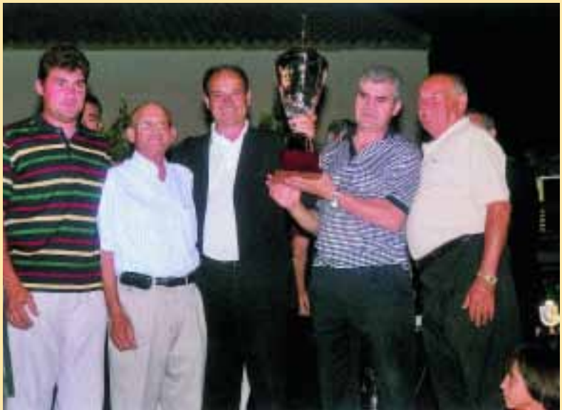
Tercer clasificado. T.F.