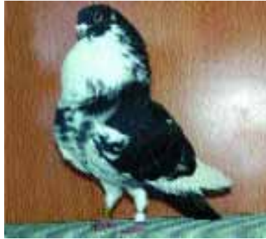
1.º MORONCELO ADULTO