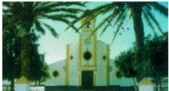
Huércal Overa acogió el Campeonato de España

Ayuntamiento, por su constante apoyo a la colombicultura y gran colaboración en el 54º Campeonato de España de Palomos Deportivos, Copa S.M. El Rey.