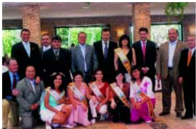
Autoridades valencianas y nacionales junto a la reina y damas del Campeonato de la Comunidad Valenciana.

Del desarrollo de las pruebas, según la información facilitada desde el equipo arbitral cabe destacar que las palomas salieron bastante movidas, realizándose varios cortes y rebotes en la segunda la paloma, por ejemplo, engañó a los palomos y se quedó sola al final. En la tercera prueba 18 palomos se quedaron solos con la suelta durante 25 minutos, en la quinta la paloma se quedó con un palomo casi llegando a los 45 minutos pero al final se quedó sola, la sexta paloma seleccionó porque tras un rebote se quedó con 18 palomos durante 11 minutos y dejó algunos palomos engañados. Finalmente todo se decidió el día de la final en que la paloma estuvo durante hora y medio