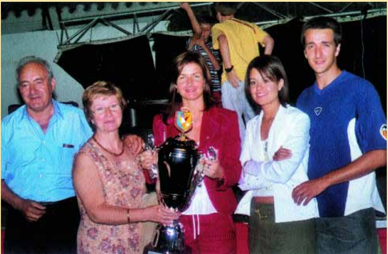
Ganador, junto a su familia y la copa tras la recogida del trofeo