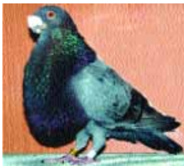
1.º LAUDINO ADULTO MACHO