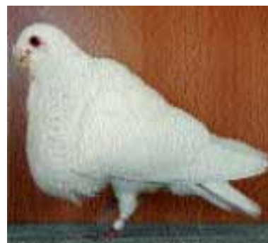
1.º GRANADINO ADULTO MACHO