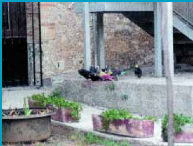
Detalle de una de las sueltas

En resumen podemos decir que todas las palomas del campeonato fueron buenas, moviéndose en todos los terrenos y dando juego a los palomos participantes. Cabe hablar y destacar el buen hacer y la buena voluntad de los palomos y de sus dueños durante todo el campeonato. Los tres