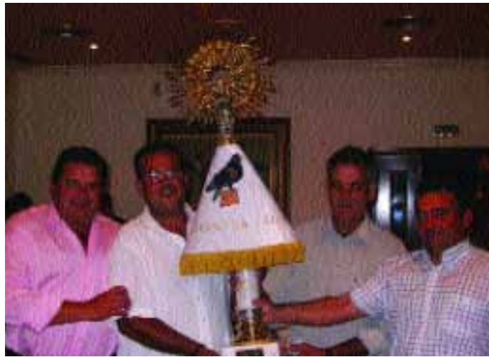
Ganadores junto al Trofeo