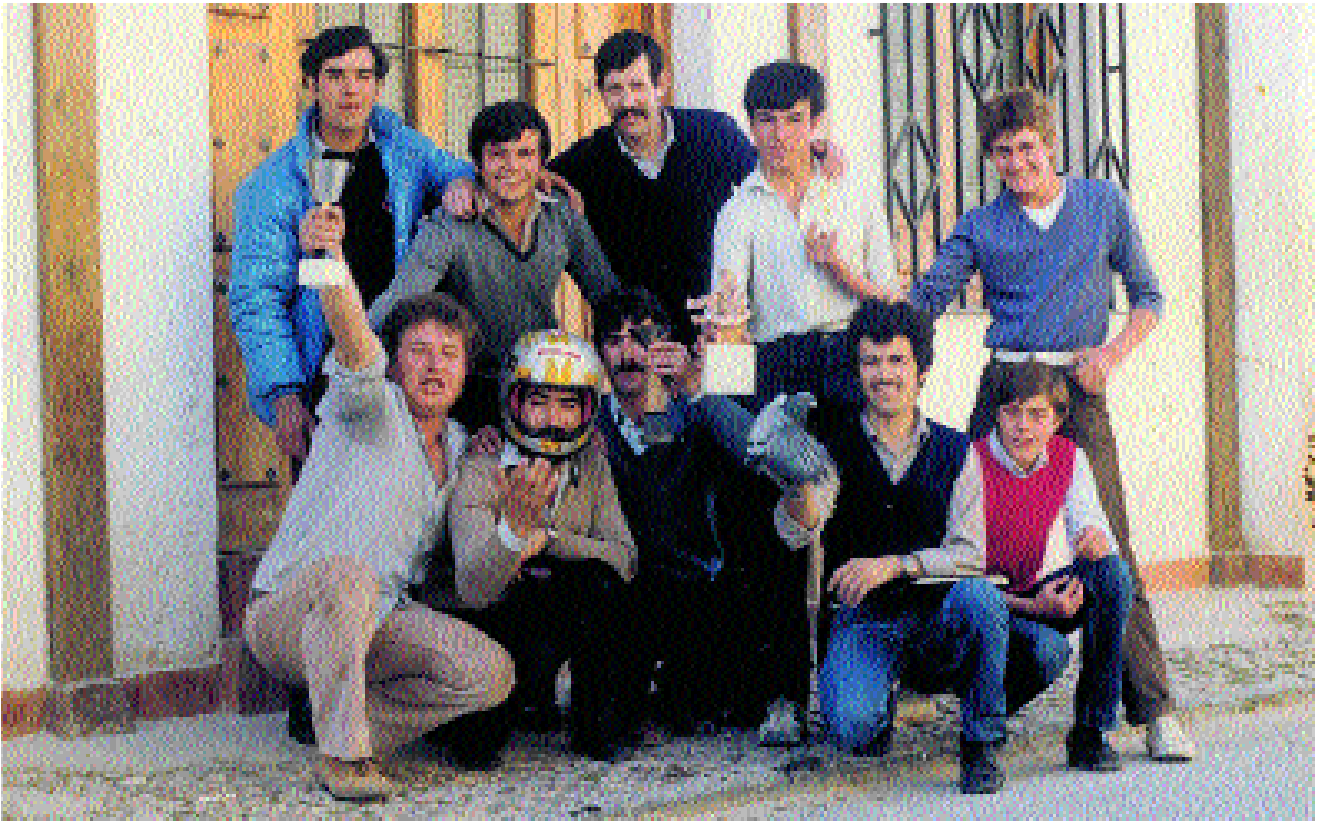
Pioneros del Club Deportivo Elemental Los Picas de Daimiel