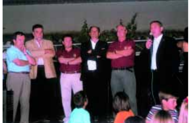
5 HUERCAL OVERA fue la sede del Campeonato de España

Nota: Los artículos que aparecen firmados expresan juicios, ideas u opiniones personales de sus autores. Su publicación no entraña necesariamente para PALOMOS DEPORTIVOS ni para la Federación Española de Colombicultura, identificación con los mismos. Las fotografías que aparecen en la revista PALOMOS DEPORTIVOS han sido facilitadas por las distintas Federaciones, Pepe Zarzoso, Trini Fernández, Club de Coloms Putxet, Alberto Martínez, María Pons y los autores o entrevistados de los artículos.