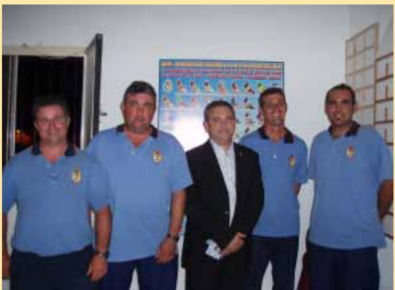
Equipo arbitral junto al presidente. B.N.S.