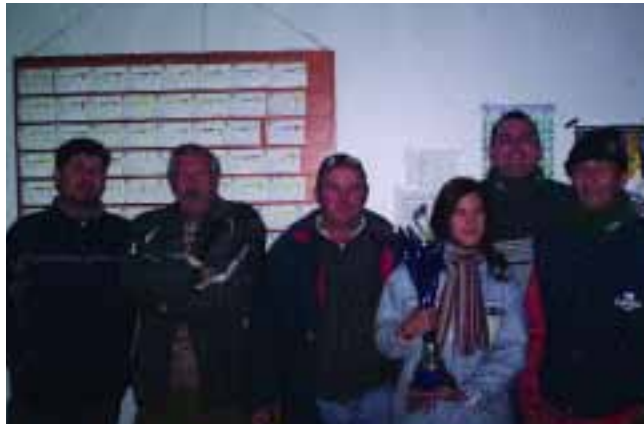
Ganadores y distintos momentos de las sueltas

Sin tregua y a la velocidad que marca la competición, esta sociedad organiza uno de los clasificatorios para el provincial, del que le mantendremos informados de su desarrollo.