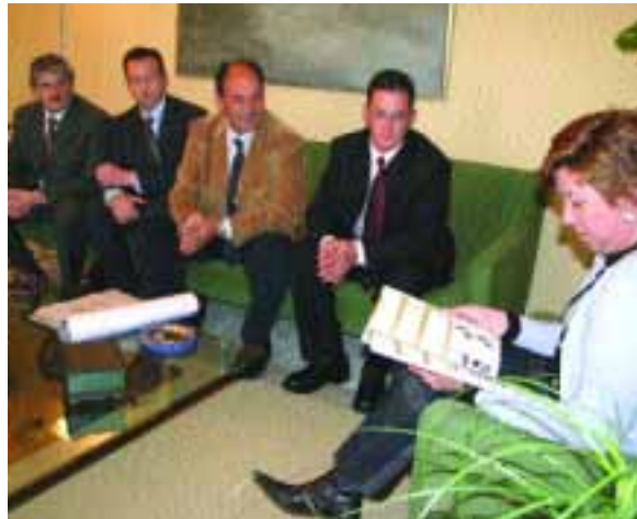
La Alcaldesa recibió a los representantes del club de raza y la Federación de Murcia