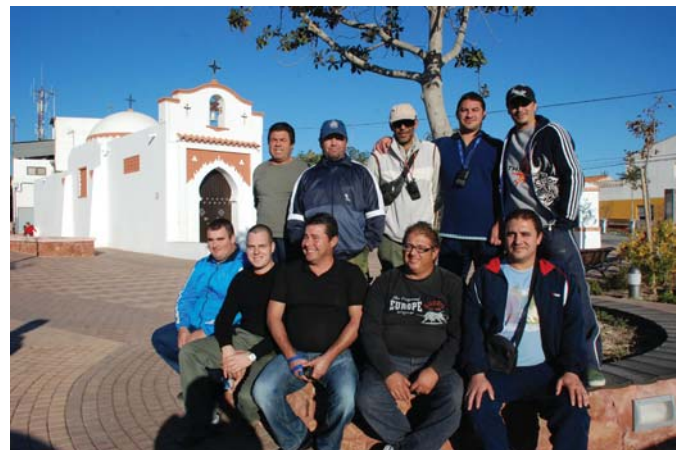
El Club Virgen del Mar inició la temporada

JM Hoteles Santa Pola, ficu detrás el Camping Bahía, terraza de Avda. Portus y Espoz y Mina, hasta su destino final del Edificio Redondo contiguo al Colegio Alonai.