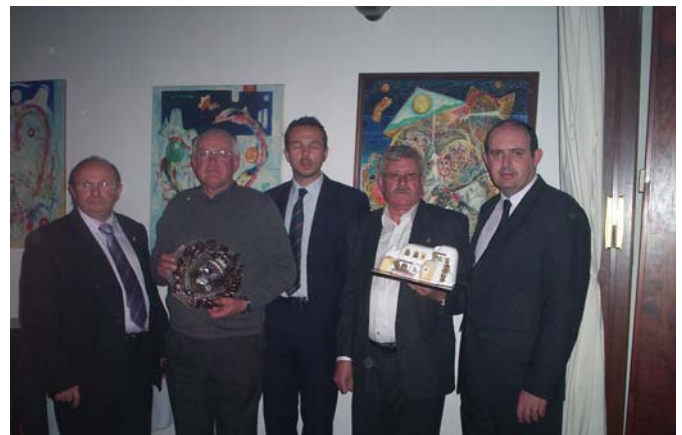
Autoridades y ganadores durante la entrega de galardones

Esta exposición ha contado con una participación de 185 ejemplares, lo cual es destacable positivamente teniendo en cuenta las dificultades que existen de transporte con la isla, aparte de las dificultades económicas derivadas de la situación económica que atraviesa el país en general, como siempre destacó la participación de la raza de la tierra, el Buchón Balear, seguido de Gaditano, Jiennense, Moroncelo, Veleño y Granadino. El día grande de la exposición fue el domingo 18, día en que estuvo abierta al público y que coincidió con el día grande de