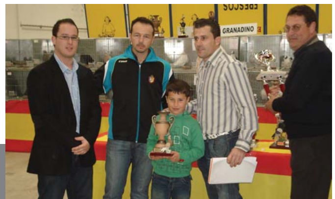
Entrega de trofeos