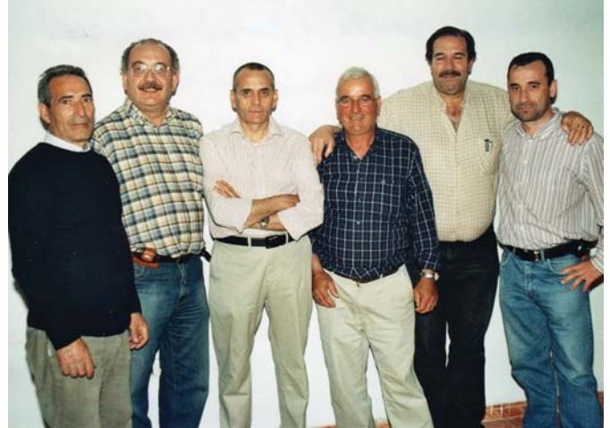
Junta Directiva del Club "La Estrella" de Navalagamella (Madrid)

Mucho se ha escrito de Navalagamella, de su historia, de su comercio; de sus fiestas patronales y, curiosamente, con ese nexo de unión que todavía muchos no conocen: el Arcángel San Miguel, que da su nombre al Club de Villamantilla y que se apareciera, según cuenta la leyenda, en Navalagamella, allá por el lejano Siglo XV. Desde el punto de vista deportivo decir que concretamente fue el 14 de julio de 1989 en que la Dirección