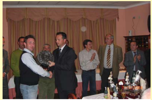
El delegado de Raza en la RFEC entregando uno de los trofeos de las Jornadas