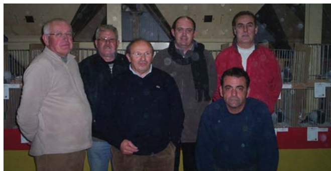
En la exposición