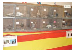
Vistas de la Exposición