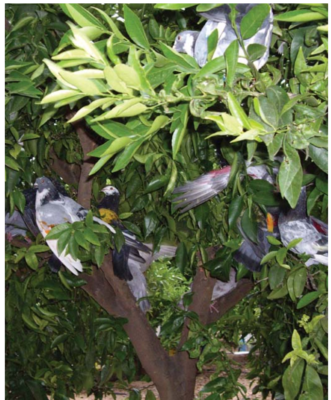
El cambio de reglamentos pretende aumentar el espectáculo de las pruebas en la competición deportiva