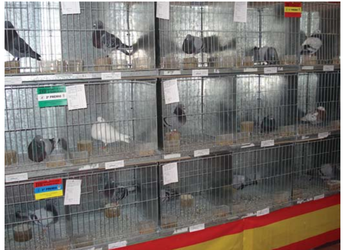
La sección de raza también ha modificado su reglamento

Estamos trabajando muy seriamente en la selección de palomas para el Campeonato Nacional para que acudan los