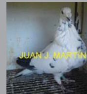
Distintos ejemplares del Buchón Gorguero (en proceso de estandarización por la RFEC)

Le contesté que no estaría mal que se organizaran algunas charlas informativas referentes a las razas, y en concreto le expliqué que el pasado mes de Abril había tenido lugar, en Barcelona, una feria de muestras dedicada a explotaciones, maquinaria, alimentación y accesorios, todo orientado hacia la ganadería intensiva. Pues bien, en el marco de dicha feria, tuvo lugar un congreso de etnología avícola, llamada Expoaviga, en la que se dieron charlas sobre algunas razas de palomas, tanto buchonas como de fantasía, y en concreto yo mismo di una sobre la raza de buchones que cultivo, el antiguo buchón gorguero.