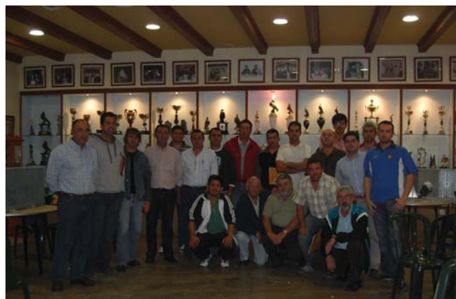
Asistentes al curso celebrado en Arcos de la Frontera