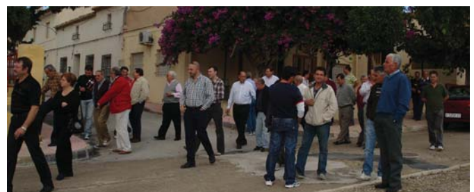
Distintas imágenes de la constitución del club