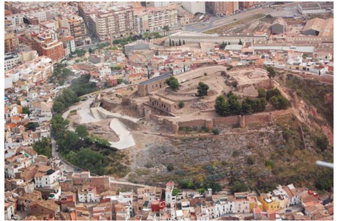
Vista aérea del Castillo de Onda y sus alrededores

Por cada modalidad de raza, en adultos y pichones, el primer