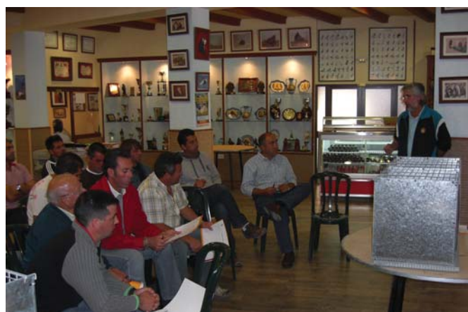
Durante la celebración del curso de Arcos de la Frontera