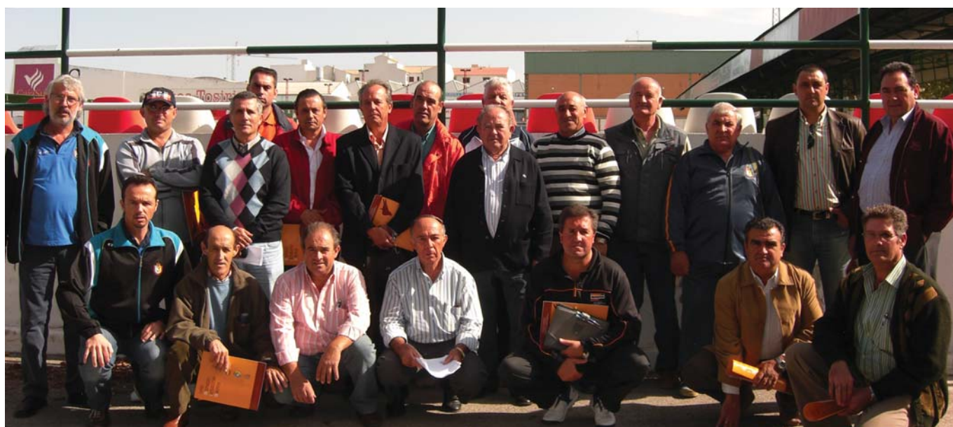
Participantes en el curso COE celebrado en la localidad jiennense de Torredonjimeno