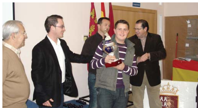
Entrega de trofeos

El domingo 8 de febrero a las 12 del mediodía tuvo lugar un vino de honor, con una posterior entrega de premios como acto de