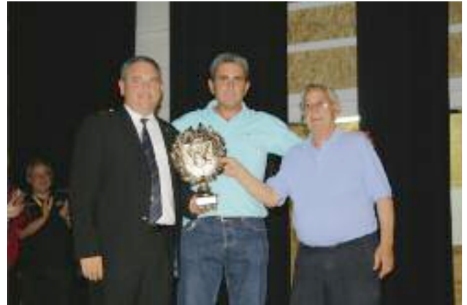
Entrega del premio a la mejor paloma de la competición.

Paloma azul, de numeración AG 639529, sale a vuelo a las 19,30 horas, vuela unos minutos y se para con todo el grupo en los pinos de la Iglesia, hace varias paradas más en pinos dentro de la población, a continuación se sale hacia la carretera de Ayora y a unos 500 metros se para en unos pinos pequeños, se produce un rebote y se quedan aproximadamente 13 palomos, entre ellos, AGOSTEÑO, BULLERO, MOLINE ROGUE, LA CRISIS, ULISES, PANZA BLANCA, COLA AZUL, PATA PALO, SAVIA, MASO, SILFO, ATICO, LA LETRA, a los 5 minutos vuelven los palomos y tras diferentes rebotes sale a volar de nuevo, hace varias paradas nuevamente en los chopos y