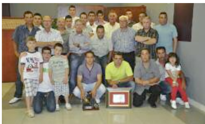
Club Santa Cruz de Alpera.

Tras la entrega de premios finalizó el 60 Campeonato de España y se comienza ya con la preparación del 61 Campeonato de España, Copa S.M. El Rey, que se tendrá lugar en San Javier (Murcia).