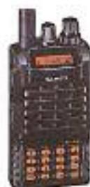
FT - 250 106'00 €