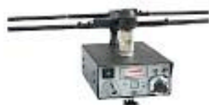
Ayama los de siempre, actualizados y REBAJADOS NUEVO PRECIO 420'00 €