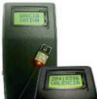
Lector de emisores con código personal