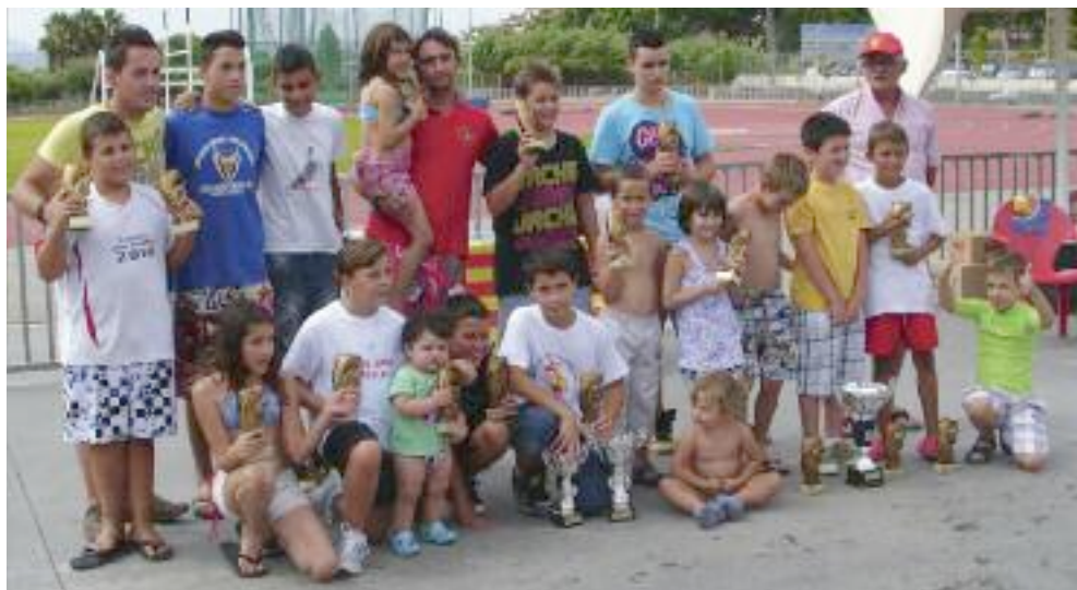
Participantes en la competición organizada desde la Federación de Cataluña