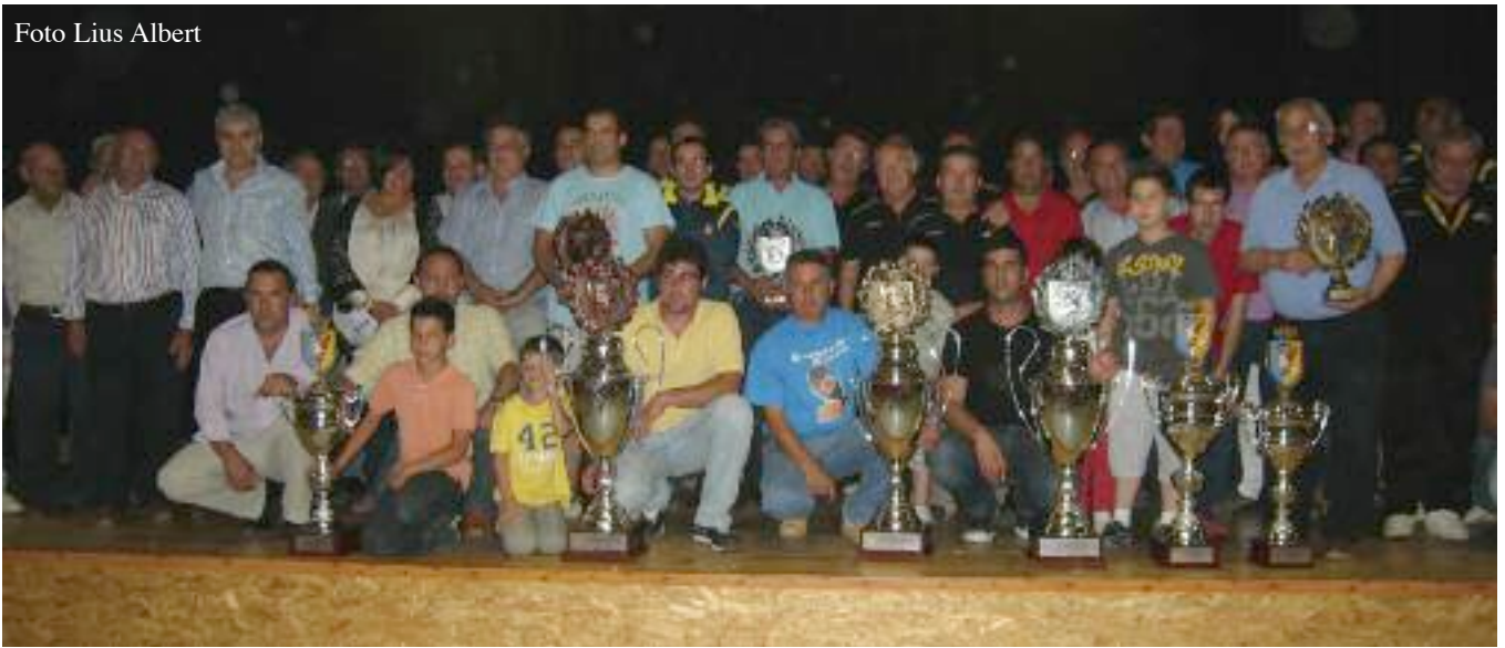
Ganadores del Campeonato junto a las autoridades