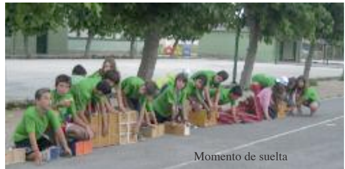
Momento de suelta

El futuro es incierto y no por ello debemos caer en la pasividad o en el desinterés. Pues la más que favorable experiencia del curso pasado, tenemos previsto desde el club, incidir en todo lo que respecta a la atención y cuidado de estos nuevos miembros que se integraran inminentemente en la disciplina del club, desde la Actividad extraescolar intentar mejorar los factores mas ásperos ( la teoría) no cayendo en la monotonía y procurando un ambiente mas interactivo.