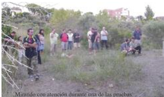
Mirando con atención durante una de las pruebas

Esperamos que os animéis a participar el año que viene.