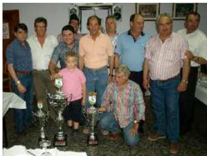
Ganadores de la competición junto a las autoridades deportivas

Por la tarde tuvo lugar la ultima suelta, con enorme expectación, ya que el palomo que iba líder, se quedo cortado y al final perdió la cabeza de la clasificación, debiéndose efectuar sorteo para decidir el orden de los tres primeros clasificados.