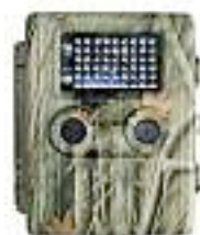
Camara de caza grabación automática

No necesita tensión a 220 v Nos avisa al movil. Sin mantenimiento. Escuche desde su movil lo que ocurre donde esta instalada PVP 149'00 € - AUTOINSTALABLE