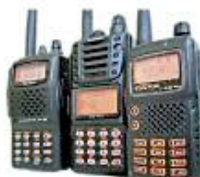
Walkys desde 65,00 €