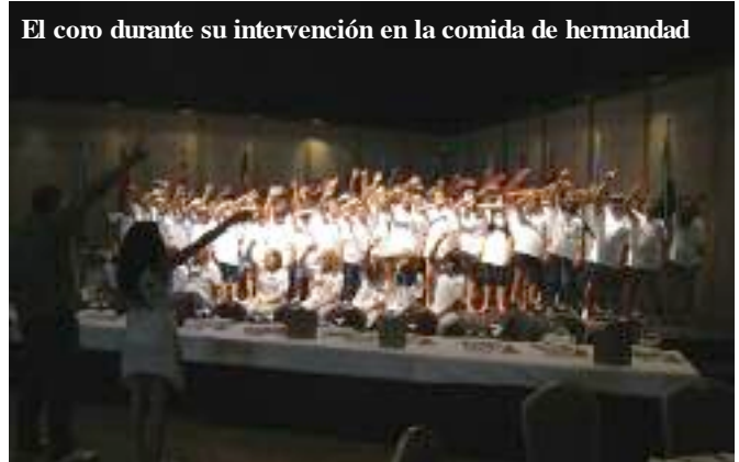
El coro durante su intervención en la comida de hermandad

Una de las principales cuestiones por la que destaca este campeonato es que tanto el alojamiento, compuesto por una serie de cabañas de madera donde estuvieron los juveniles y monitores, como las pistas deportivas y la piscina, así como las comidas, se desarrollaron en el Polideportivo de San Javier. Esta entidad, gestionada por el Patronato Deportivo de San Javier, puso a disposición de la organización distintas pistas en las que