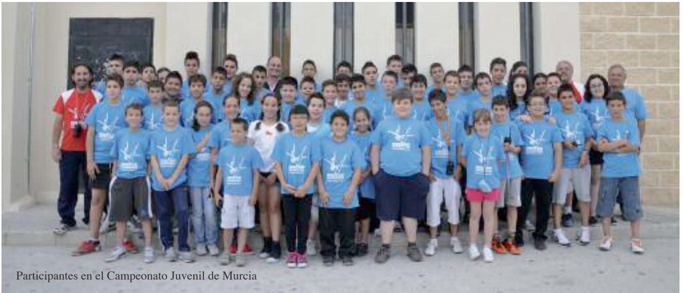
Participantes en el Campeonato Juvenil de Murcia