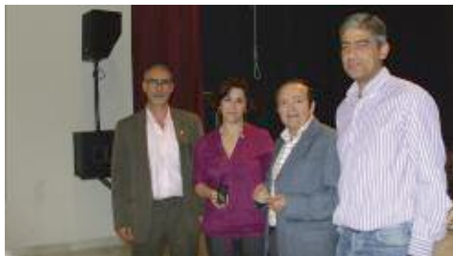
Concejal, Presidente de la FAC, Trabajadora social y Director del curso