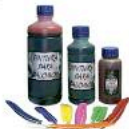
LA MEJOR PINTURA