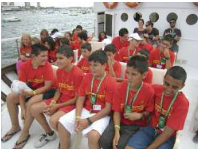
Durante la visita en barco al Mar Menor