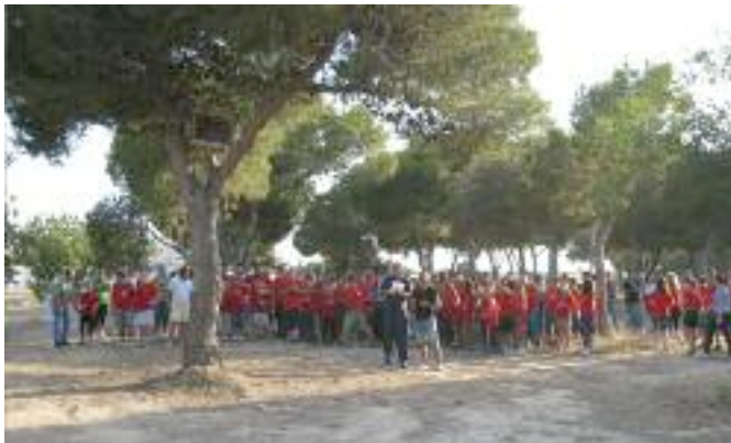
Una de las sueltas del campeonato

En el transcurso de la comida la Real Federación Española de Colombicultura, dio a todos los participantes del XXII Campeonato de España Juvenil, Copa S.M. El Rey una mochila, el programa del campeonato, un diploma de participación y un cuelga. Además, la empresa Gaum S.A obsequió a los juveniles con un bebedero y un comedero para palomos, la Federación Andaluza les regaló una revista y un colgante y la empresa Todopalomos entregó a los participantes pintura para palomos.