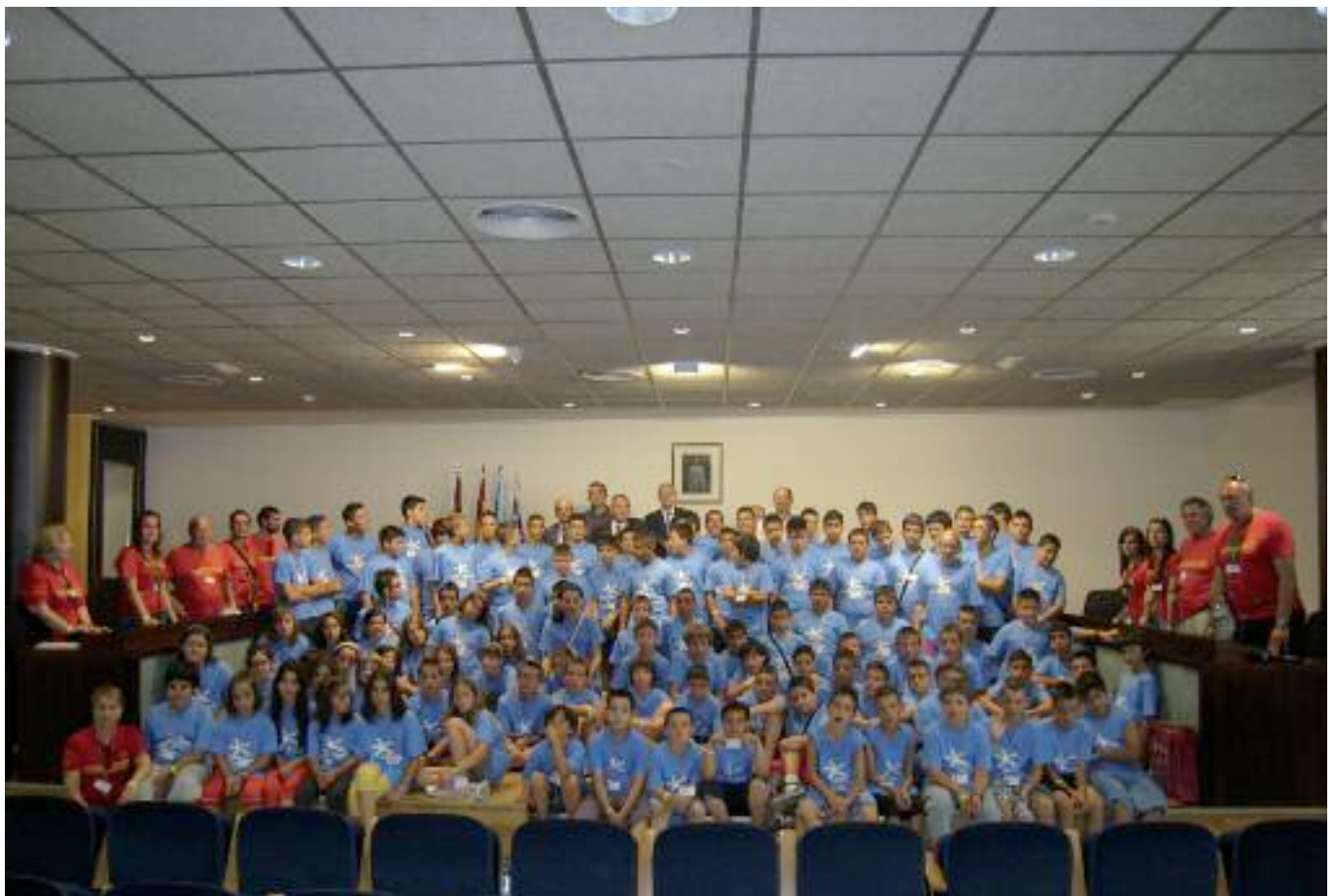
Juveniles, monitores y autoridades durante su visita al Ayuntamiento

Una de las principales cuestiones por la que destaca este campeonato es que tanto el alojamiento, compuesto por una serie de cabañas de madera donde estuvieron los juveniles y monitores, como las pistas deportivas y la piscina, así como las comidas, se desarrollaron en el Polideportivo de San Javier. Esta entidad, gestionada por el Patronato Deportivo de San Javier, puso a disposición de la organización distintas pistas en las que