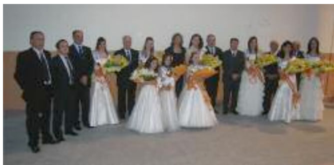
Reinas, damas y autoridades.