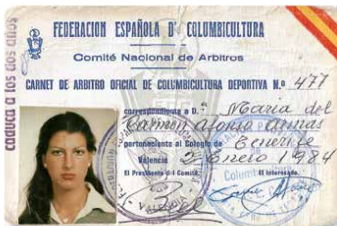
Pionera a nivel nacional y única árbitro de Canarias hasta la fecha.