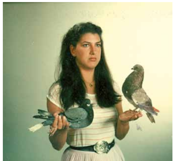
Mejor deportista en 1983, nombrada por el Cabildo de Tenerife.

Un beso, abuela, me siento orgullosa de ti.