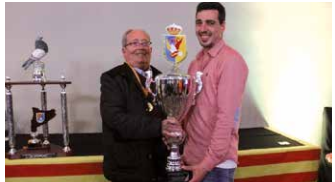
Campeón de Catalunya

Fotografías: Carla Palazzi Cao, fotógrafa oficial de la FCCE