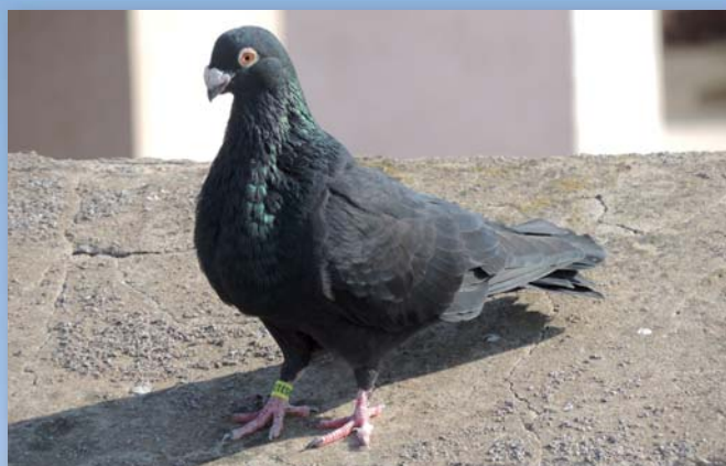
Hembra con 10 meses