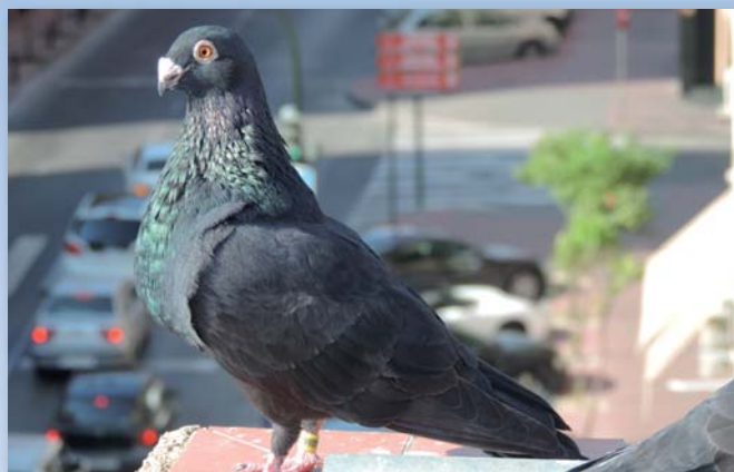
Macho con 10 meses