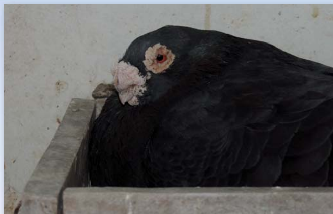
Macho con 6 años